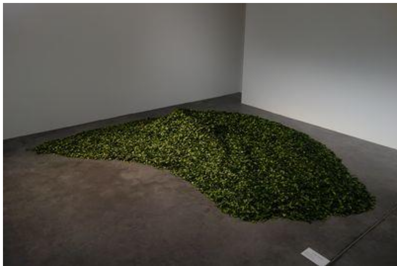
Souffle de feuilles , Giuseppe Penone. 1976-1979, bronze et feuilles de buis, 300x300x40. Musée d'art moderne, de la Ville de Paris.