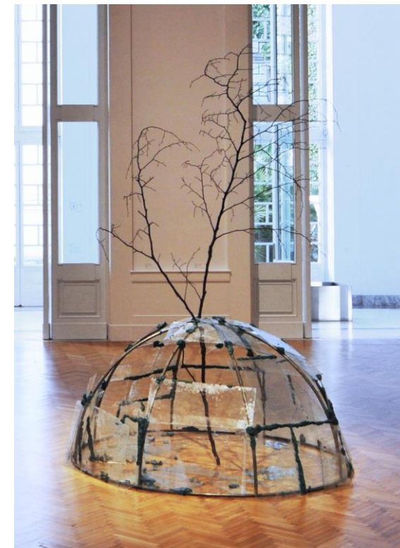
Igloo avec arbre, Mario Merz, 1969