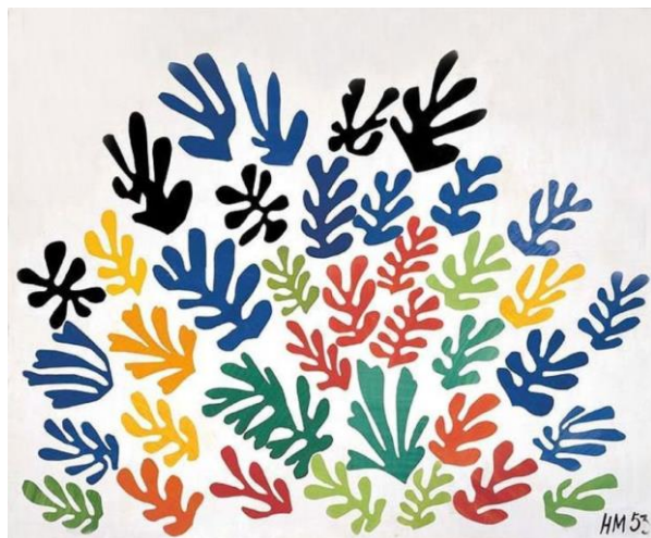
Gerbe, Henri Matisse | 1953

C'est aussi un medium, la feuille de papier, dont se sont emparés les artistes modernes et contemporains.