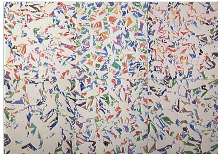
Blancs, 1973, Simon Hantai