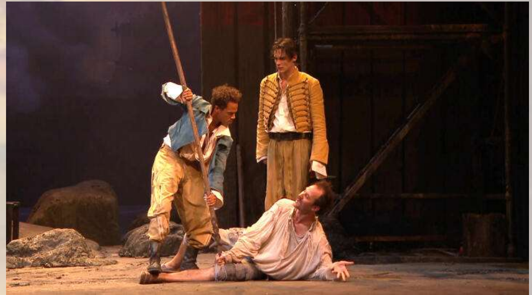
Les fourberies de Scapin par la Comédie Française 2017